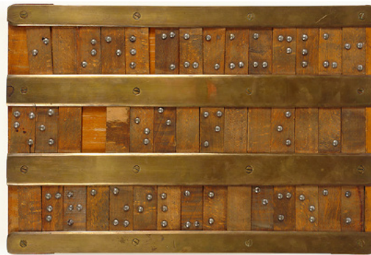
Slovarica, D. Šiftar, 2008.

U nastavku ispod zaštitnog stakla izložena je slovarica, pomagalo u nastavi početnog čitanja brajicom, koja je nastala krajem 19. st. Njene dimenzije su 35 x 23 x 2 cm, a Tiflološkom muzeju ju je 1958. darovao Zavod „Veljko Ramadanić“ iz Zemuna u Srbiji. Slovarica se koristila u nastavi čitanja od sredine 19. stoljeća u bečkom Zavodu za odgoj i obrazovanje slijepe djece.