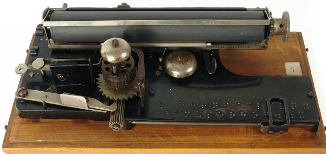
Pisaći stroj Picht, D. Šiftar, 2008.

Opis: Stroj se sastoji od drvene podloge na koju se učvršćuje mehanizam kojim se pišu Brailleova slova. Mehanizam ima po 3 tipke s lijeve i desne strane i jednu za pomicanje mjesta za sljedeće slovo. Za prelazak u novi red potrebno je mehanizam premjestiti u sljedeće utore na pisaćoj podlozi. Strojem se piše zrcalno, a čita se okretanjem lista papira u negativu (Sivec, 2008).