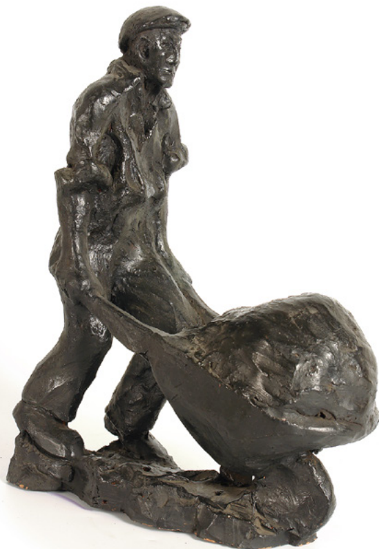
Radnik s tačkama, D. Šiftar, 2008.

Skulptura Radnik s tačkama izrađena je od patinirane terakote. To je realističan prikaz radnika koji gura natovarene tačke. Zasukani rukavi, istegnute ruke i savijena koljena pokazuju napor koji radnik osjeća (Šiftar, 2008).