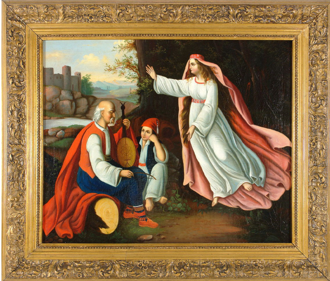
Slijepac i vila, Vjekoslav Karas, oko 1850.

*Opis: Osnova kompozicije ostvarena je prema uzoru na majstore rane renesanse. Odnos između tri spomenuta lika jest znakovit. Djed koji je, kako tradicija zahtijeva, slijepi starac s guzlama, unuk koji ga pozorno sluša zamišljena pogleda i vila koja lebdi u zraku. Reljefnost modelacije naglašena je naročito bogatom draperijom i pratećom igrom svjetla i sjene, a popraćena je i kolorističkim rješenjem likova: oni su istaknuti kromatskom crvenom i akromatskom bijelom bojom (Bosnar Salihagić, 2008).