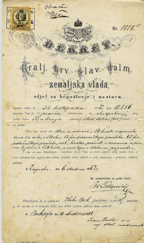
Dekret, Kralj.hrv.-slav.-dalm. Zemaljska vlada, 1882.

*Opis: Dekret je djelomično tiskan, a tekst koji se odnosi na V. Beka upisivan je rukom. Zapisano je da se Vinku Beku propisuje plaća od četiri stotine forinta godišnje, da na raspolaganje dobiva stan, 14 hvati cijjepanih drva za sebe i školu, 12 forinti pisarničkog paušala, 45 forinti podslužničkog paušala, vrt, livadu, pašnjak i oranice. U dokumentu se potvrđuje da je Vinko Bek položio službenu prisegu propisanu naredbom, što potpisom potvrđuje Ivan Pintar, mjesni školski nadzornik u Bukevju (Čosić, 2008).