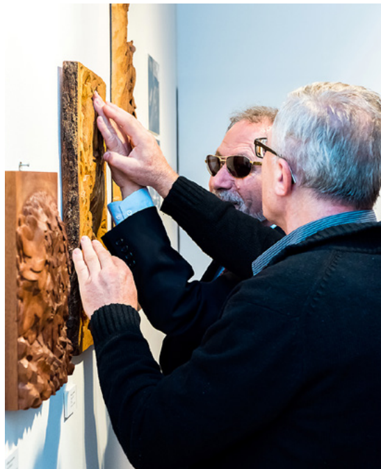
Reljefi s izložbe Uoči umjetnost, R. Vukić, 2016.

Maska I prikaz je pomalo izobličenog ljudskog lica. Ispod visokog čela i naglašenih obrva nalaze se dva uska otvora za oči. Lice je koščato s izraženim jabučicama na obrazima, a nos plosnat s velikim nosnicama. Usta su otvorena, a na gornjem dijelu ispod usnice se nazire jedan polomljeni zub. Maska odaje tužan izraz lica.