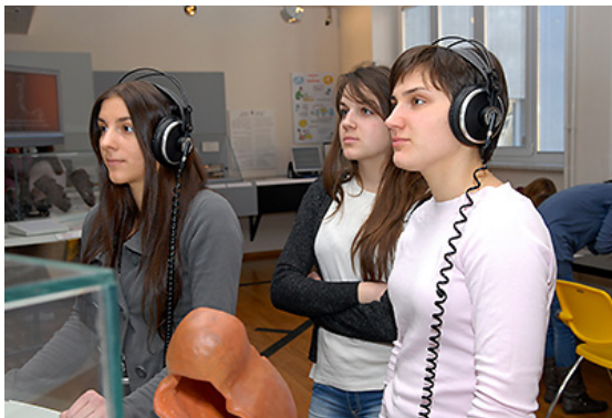
Iz Stalnog postava Tifološkog muzeja, D. Šiftar, 2009.

Skulptura prikazuje stilizirane figure dviju ženskih osoba koje sjede na postolju, okrenute tijelom jedna prema drugoj, u nijemom dijalogu. Figura s vaše lijeve strane okrenuta je leđima ulijevo, a glavom, licem udesno. Figura s vaše desne strane okrenuta je leđima udesno, a glavom, licem ulijevo. Glave figura male su i oble, kose skupljene u punđu. U nastavku su njihova tijela bez naglašenih ruku. Cijela površina figura izbrazdana je tankim uzdužnim vijugavim urezima koji asociraju na odjeću. Njihova tijela se u podnožju spajaju i preklapaju (Šiftar, 2008).