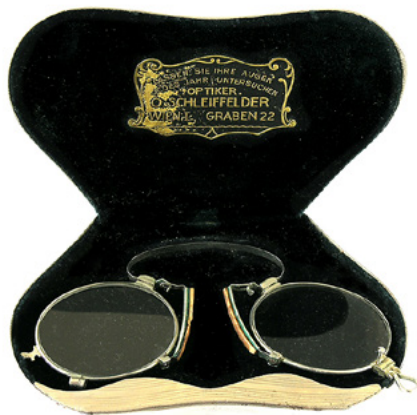
Cviker Vinka Beka, D. Šiftar, 2008.

metalni etui srebrne boje, koji je s unutrašnje strane obložen tamnoplavom tkaninom, filcom. Na poklopcu s unutarne strane etuija otisnuto je i uokvireno zlatnim slovima ime optičara Schleiffeldera iz Beča, a povrh toga je tekst na njemačkom jeziku Lassen sie ihre Augen jedes Jahr untersuchen (Pregledavajte oči svake godine) (Sivec, 2008).