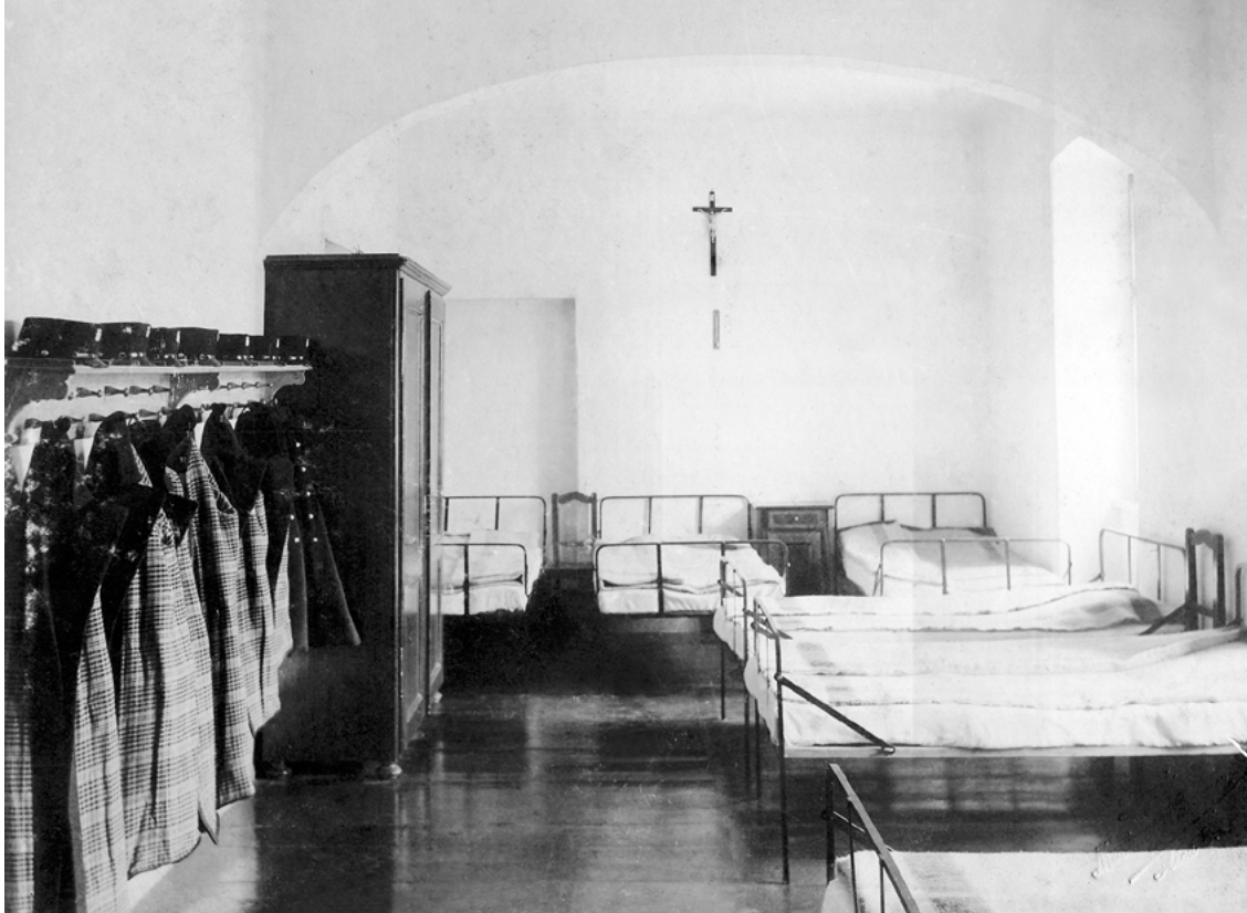
Spavaonica u Zemaljskom zavodu za odgoj slijepe djece, Mosinger i Breyer, oko 1900.