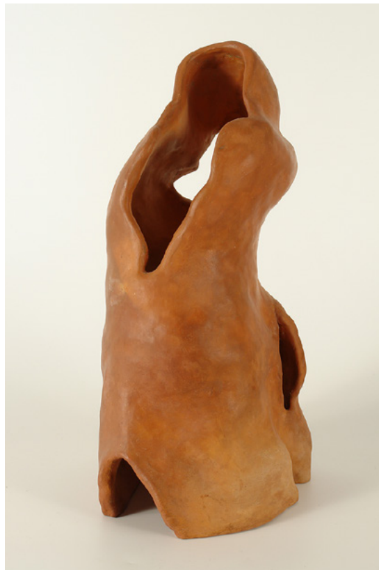
Pulena, D.Šiftar, 2008.

Skulptura Razgovor izrađena je u Zagrebu 2004. godine. Izrađena je od patinirane terakote, visine 20, a širine 14 cm. Ova skulptura se nalazi u Zbirci likovnih radova Tifloškog muzeja i otkupljena je od autorice.