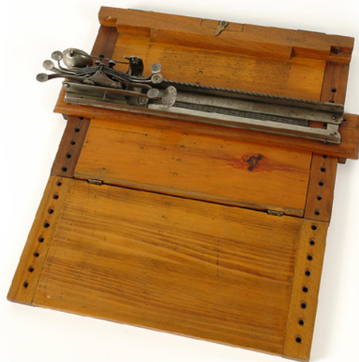
Pisači stroj Stainsby, D. Šiftar, 2008.

Opis: S obzirom na to da o ovom predmetu postoji vrlo malo podataka, on je još uvijek predmet istraživanja. Pretpostavlja se da je samo dio tiskarske naprave kakve su korištene za reljefni tisak s kraja 19. stoljeća. Na vlažan papir bi se pod prešom utiskivala reljefna slova. Kada bi se papir osušio, utisnuta slova bi se s druge strane zadržala kao reljef koji se čitao prstima (Sivec, 2008).