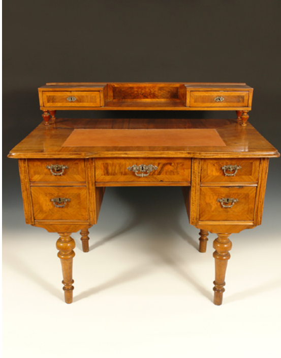
Pisaći stol, D. Šiftar, 2008.

*Opis: Pisaći stol sastoji se od glavne površine za pisanje, na kojoj se nalazi zaštitno staklo ispod kojeg su smještene 3 knjige i naočale Vinke Beka. Na stražnjem dijelu stola postavljen je, na 4 stilizirane nožice, još jedan dio stola, koji s lijeve i desne strane ima po jednu malu ladicu. Između njih je prazan prostor koji izgleda kao otvorena polica. Ispod glavne radne površine stola nalaze se ladice, sa svake strane po dvije, smještene jedna ispod druge te jedna ladicu u sredini. Radni stol ima četiri stilizirane noge ukrašene rezbarijom.